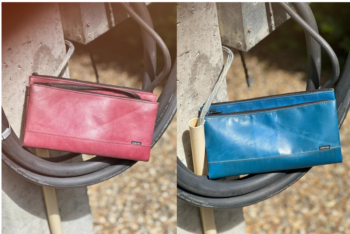
ภาพที่ ก.1 ตัวอย่างกระเป๋า Freitag รุ่น Masikura ที่ใช้ในการขาย