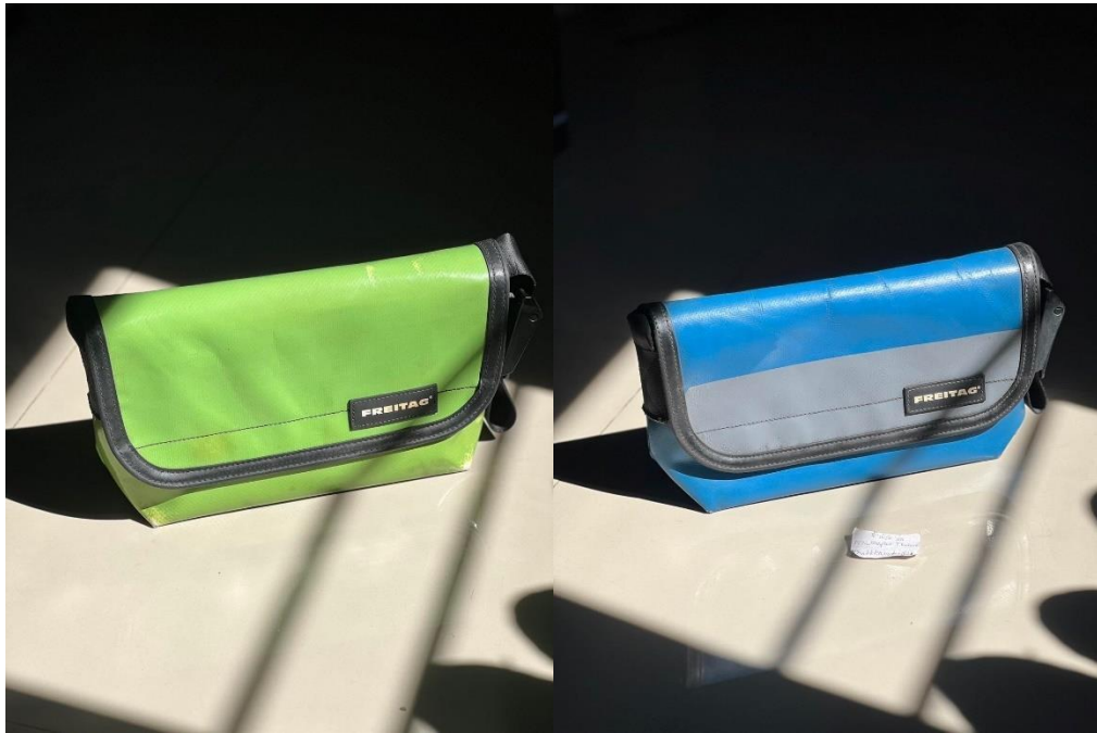
ภาพที่ ก.3 ตัวอย่างกระเป๋า Freitag รุ่น Hawaii Five-o ที่ใช้ในการขาย