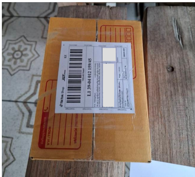
ภาพที่ ก.5 กล่องพัสดุที่พร้อมจัดส่งที่ใช้จัดส่ง