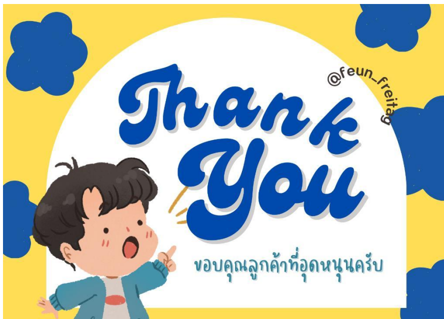
ภาพที่ ก.8 การ์ดขอบคุณที่จัดทำใหม่ของร้าน Freitag_feun958