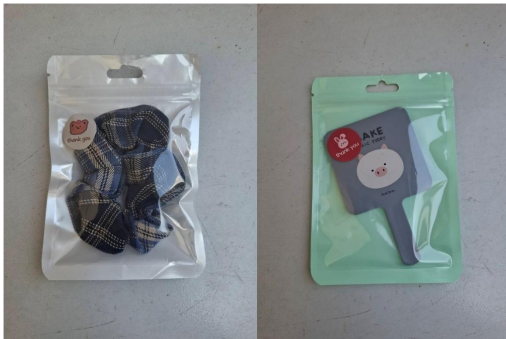
ภาพที่ ก.7 ของแถมที่จะได้รับไปพร้อมกับกระเป๋า