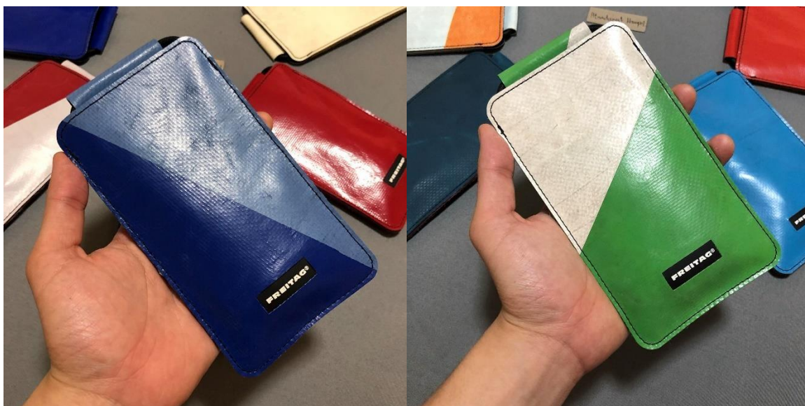
ภาพที่ ก.2 ตัวอย่างกระเป๋า Freitag รุ่น F338 Fox ที่ใช้ในการขาย