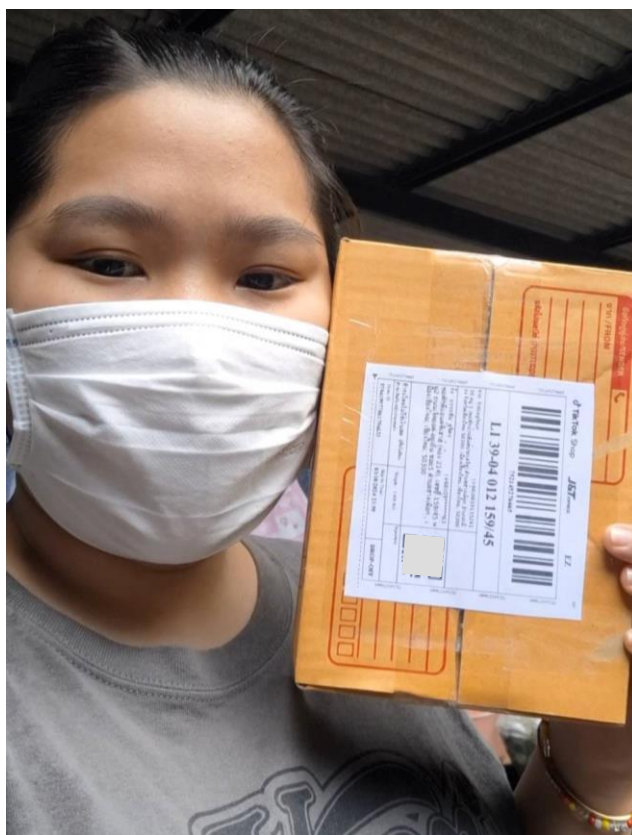
ภาพที่ ก.6 ขณะกำลังไป drop off พักดูที่สาขา