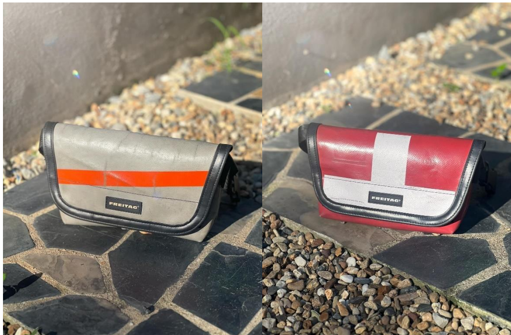
ภาพที่ ก.4 ตัวอย่างกระเป๋า Freitag รุ่น Jamie ที่ใช้ในการขาย